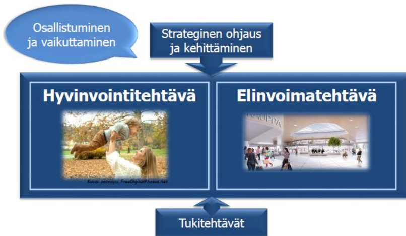
Kuva 2. Järvenpään kaupungin perustehtävät sekä strateginen ohjaus ja tuki

Järvenpään kaupungin ydin- ja tukiprosessit (kuva 2), jossa painopisteinä ovat hyvinvointi ja elinvoimaisuus sekä osallistuminen ja vaikuttaminen. Tämä Ikääntyneiden hyvinvointisuunnitelma on osa kaupungin strategiaa ja sen keskeiset linjaukset on laadittu kaupunkistrategian pohjalta.