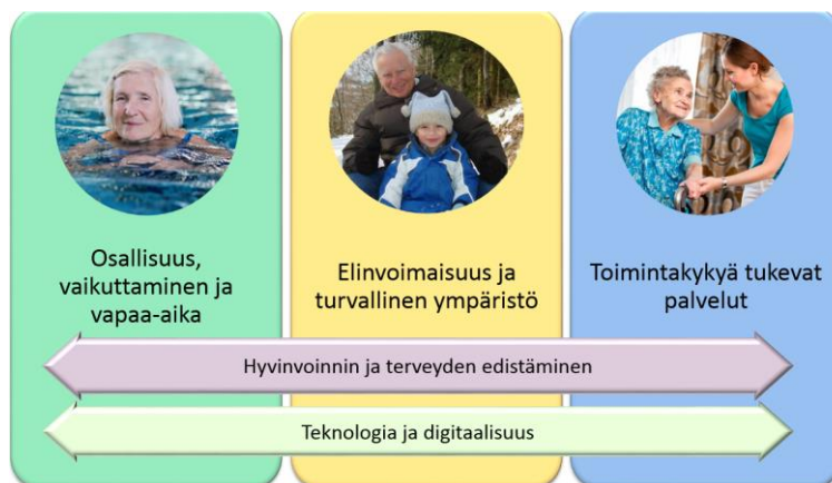
Kuva 3. Ikääntyneiden hyvinvointisuunnitelman painopisteet vuosille 2018–2019.

Jokainen teema sisältää hyvinvoinnin ja terveyden edistämisen sekä teknologian ja digitaalisuuden näkö-kulmat, joista muodostuu painopisteet (kuva 3). Suunnitelman liitteenä on tavoite- ja toimenpidesuunnitel-ma, jonka toteutumista seurataan ja arvioidaan kaupungin toiminnan raportoinnin yhteydessä.